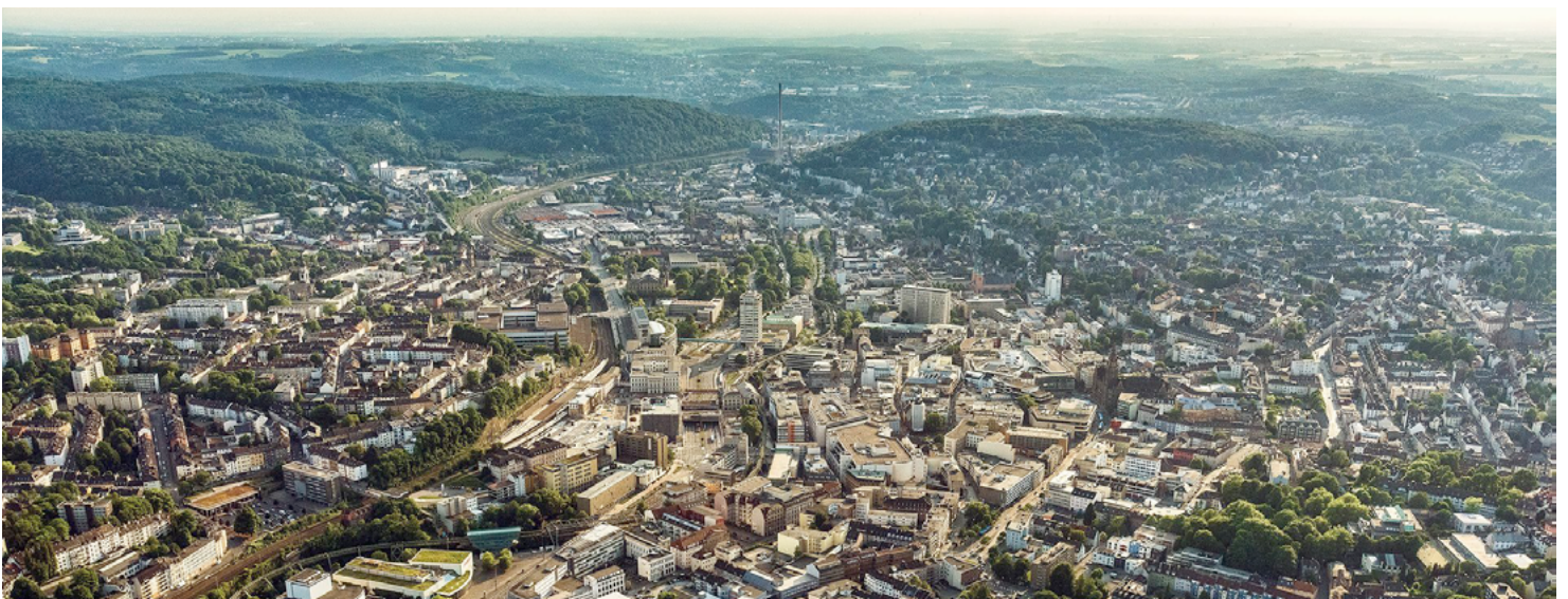
Blick auf Wuppertal