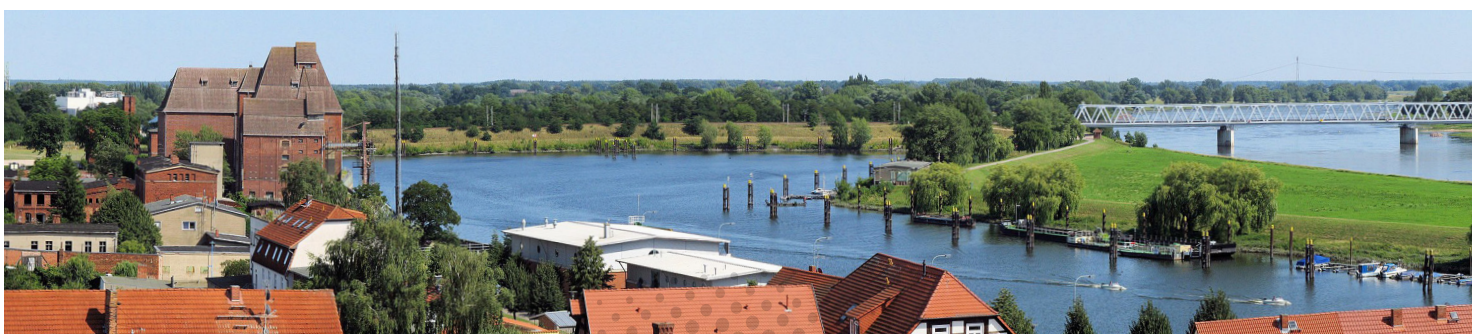
Panorama Wittenberge