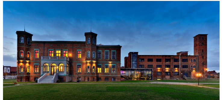
Elbe Resort Wittenberge in der Alten Ölmühle

Ein zweistündiges Sicherheitstraining für Journalist:innen, ein Workshop zu kreativen Ritualen im Elbespace, garniert mit leckeren Waffeln, Constructive Journalism, Mental Health, Datentools und ganz viel weiteren Input zum Mitnehmen und Umsetzen gibt's mit Blick auf die Elbe.