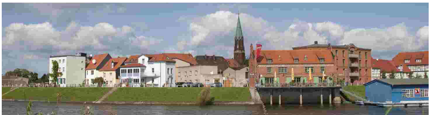
Panorama Wittenberge