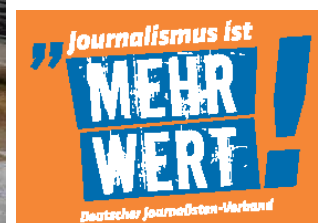
Flashmob-Aktionen im Kampf um faire Gehaltserhöhungen in Bielefeld.