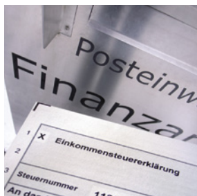
Uwe Niehuus, DJV-Bildportal