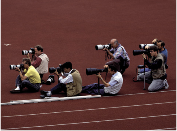
Werner Otto, DJV-Bildportal