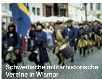
Schwedische militärhistorische Vereine in Wismar

Das Schwedenfest in Wismar erinnert jedes Jahr an die 155 Jahre währende Zugehörigkeit der Hansestadt zu Schweden. Eines der größten Stadtfeste der Region bietet den Einheimischen und ihren Besuchern zwischen 17. bis 20. August wieder jede Menge Attraktionen.