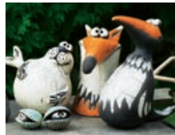
Robbe, Fuchs und Elster – die Künstlerin hat unendlich viele Ideen