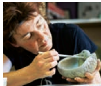
Der Ton wird aufgebaut, nicht auf der Scheibe gedreht, dann gestaltet